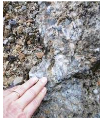
Cristalli di gesso

Motivo dominante della giornata sarà la visita al Parco dei Gessi Triassici ed alle Fonti di Poiano, due fenomeni strettamente collegati. Si pedalerà su antiche mulattiere a tratti scavate direttamente nella roccia, passando da borghi e edifici rurali costruiti con malte a base gesso. Al Parco delle Fonti i fenomeni erosivi saranno evidenti, con